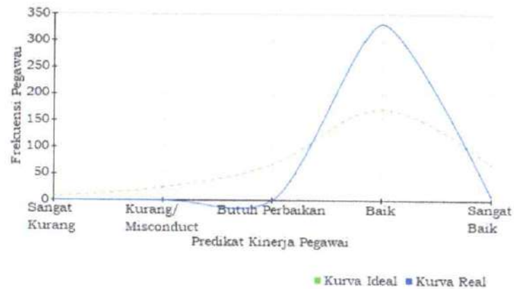
KURVA DISTRIBUSI PREDIKAT KINERJA PEGAWAI DENGAN CAPAIAN KINERJA ORGANISASI BAIK